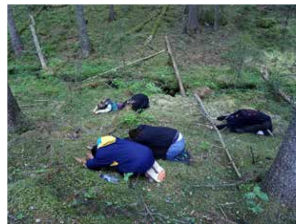
Den deltagarbaserade performance Den blå träden genomfördes dagen efter vernissage (läs mer på sid. 31).