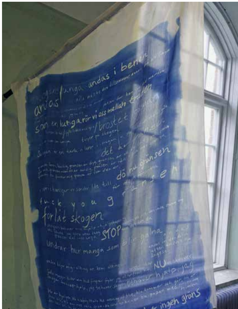
skogens lunga , Stripa gallerirum.

17 maj 2019, Stripa gallerirum, Guldsmedshyttan. Utställningen pågår t o m 14 juni 2019.