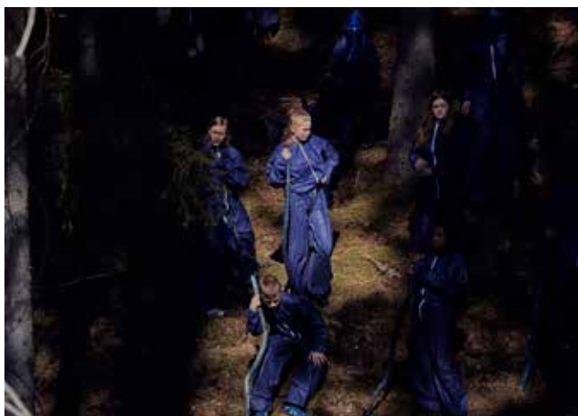
Foton: Hanna Wildow (övre bilderna) Foto från filminspelningen: Axel Öberg (nedre bilden)