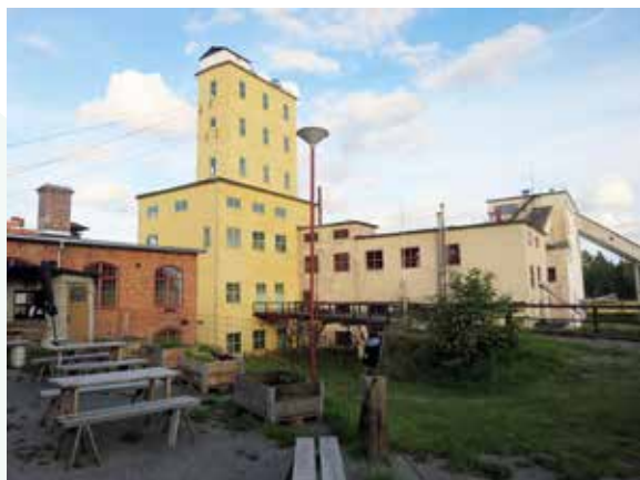
Stripa gruvmiljö.