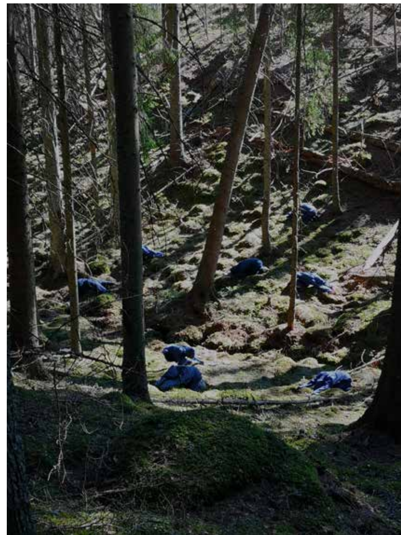
Barnets position.

Det konstnärliga arbetet pendlar mellan att söka stillhet och att sätta saker i rörelse. Projektet förhåller sig till skogen som ett skyddsrum och utforskar på flera plan skogen som en egen värld samt frågar sig vad detta andrum kan erbjuda. Idén om skogen fylls med kreativ kraft och gör den magisk i sin stillhet. Andningen är hela tiden i fokus: i samtal om vems andetag som räknas, i språk och text, som sedan blir till skulpturer, och i faktiska andningsövningar. Till exempel genom yogapositionen Barnet, en lugnande viloposition som utförts direkt i skogens mjuka mossor. Samtidigt finns rörelsen där, den aktiverade kroppen som koreograferas genom skogen och i fysiska tillitsövningar, i fysiskt arbete med trä och tryck, och i de scener som spelas in för filmen skogen behöver, jag .