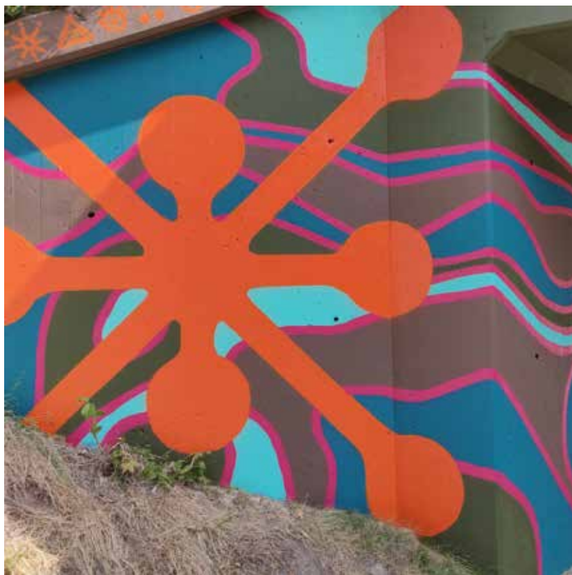
Målade tecken på portalen.