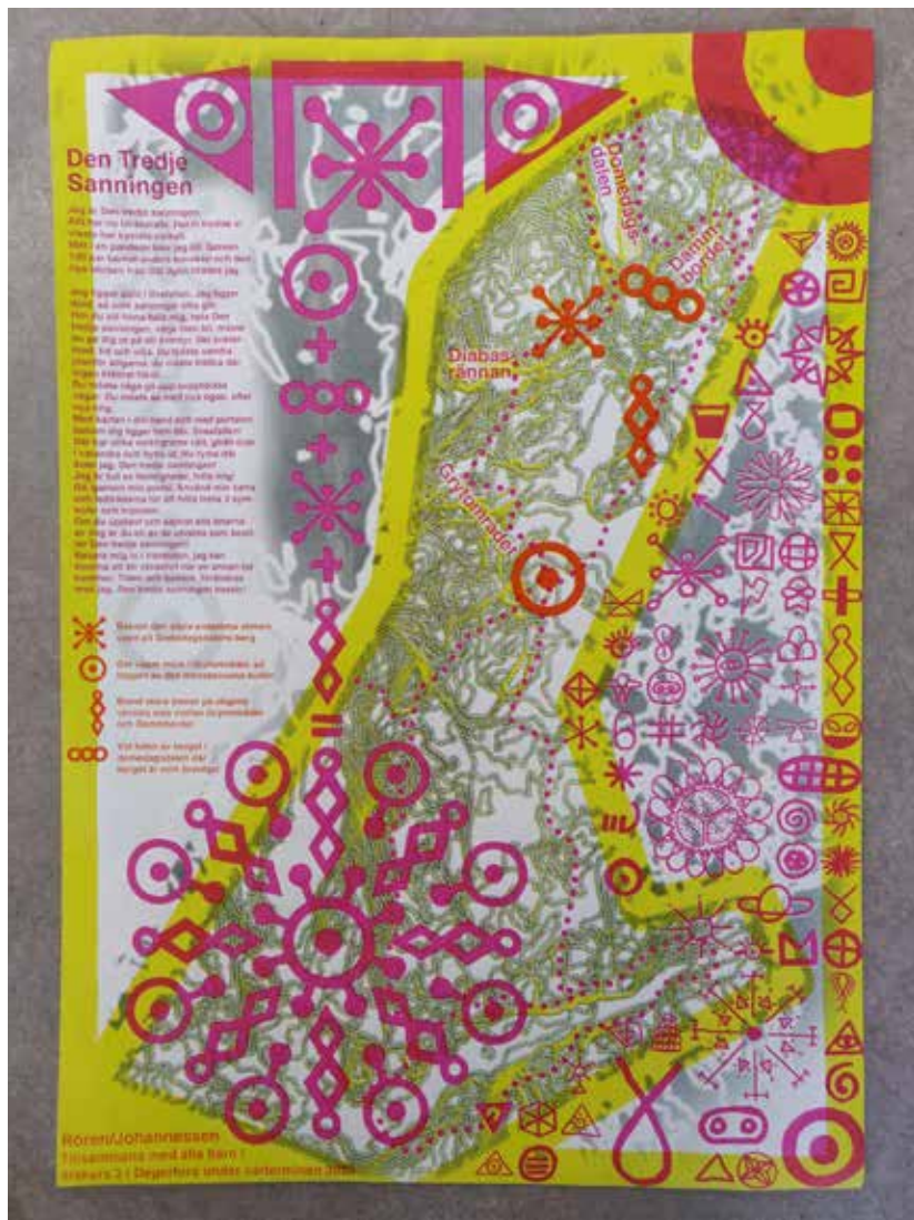
Den nya kartan över Sveafällen.