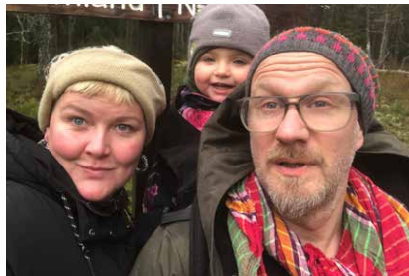
Rören/Johannessen i Sveafallen.

I Bortom de blå bergens tredje projektår fokuserade arbetet på Degerfors kommun och på de geologiskt unika Sveafallen som ligger i närhet av tätorten. Sveafallen bildades för 10 000 år sedan då inlandsisen drog sig tillbaka över området och marken som varit nedtryckt under den 3 kilometer tjocka isen successivt började höja sig. I Degerfors kommun med 22 000 invånare finns det sammanlagt fem låg- och mellanstadieskolor och samtliga elever i årskurs 3, inklusive särskoleklass, har varit involverade i projektet. Tre av skolorna finns i centrala Degerfors och två av dem är belägna strax utanför tätorten.