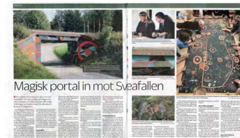
Karlskoga Tidning-Kuriren, 20200822