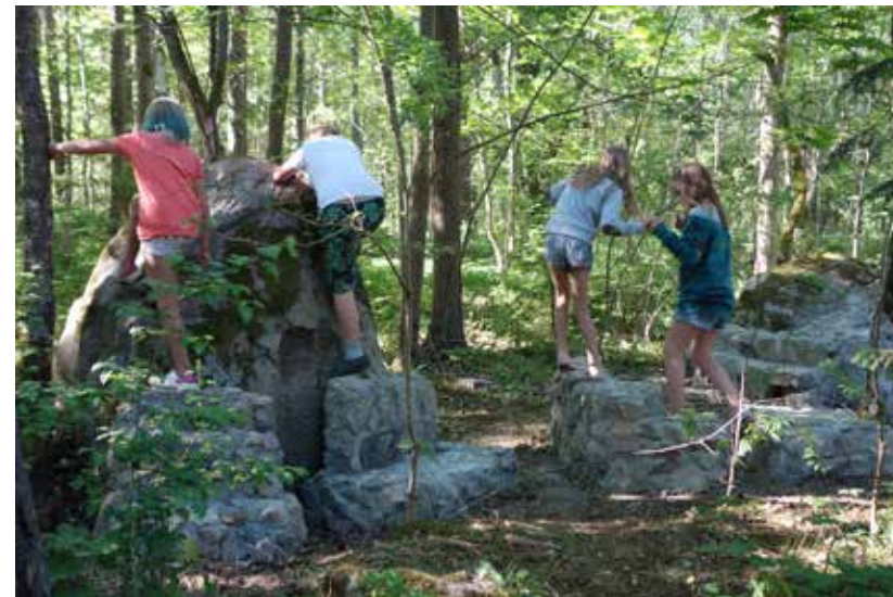
Stenmöbler i Hällabrottet av Jelena Rundqvist och årskurs 3 på Tallängens skola.

roll och vill att alla ska ha tillgång till konst i ett jämlikt samhälle. Konst för alla är därför en devis som är hjärtat även i detta projekt.