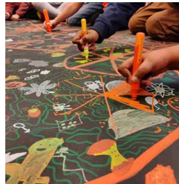
En gemensam karta tar form inom projektet Den tredje sanningen i Degerfors.