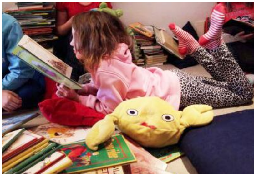
Hallsbergs kommun