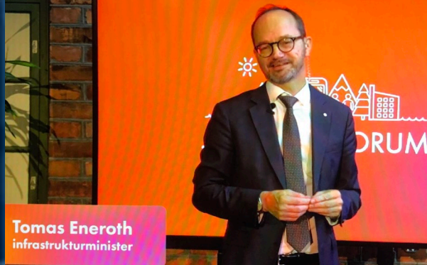
Tomas Eneroth infrastrukturminister